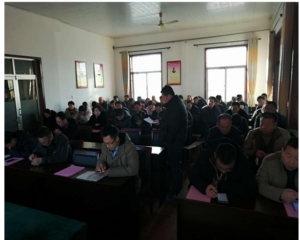
图 1 政务公开工作培训