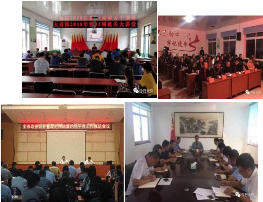
图 1 相关政务公开工作会议